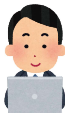
千葉リハセンター