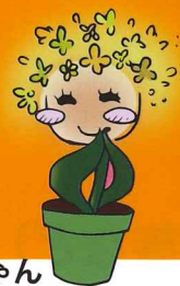
しえんちゃん 高次脳機能障害支援センターキャラクター