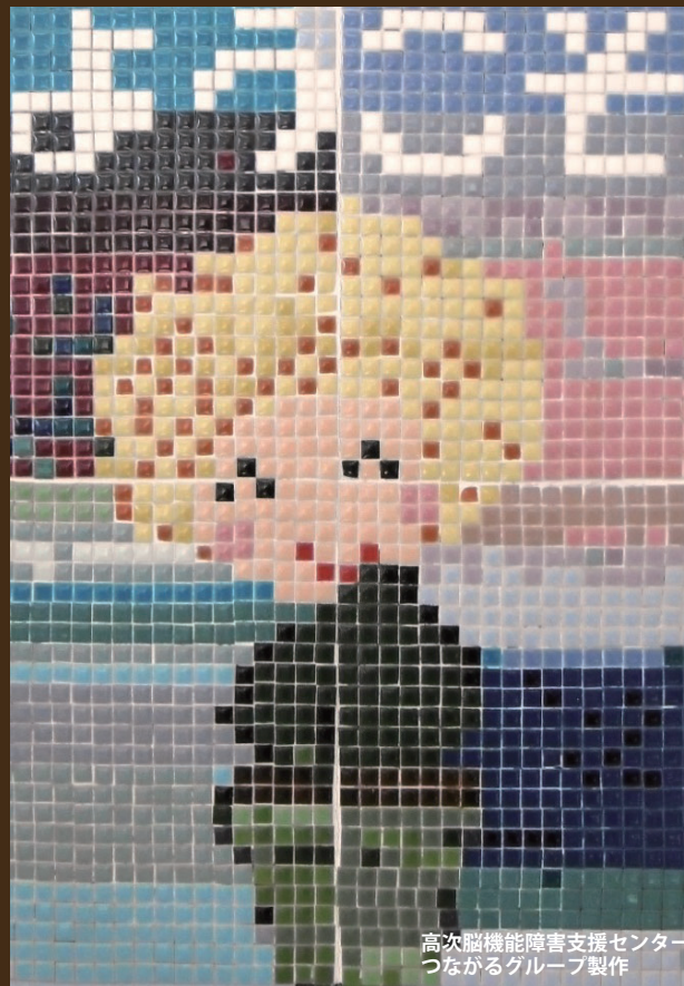
高次脳機能障害支援センター つながるグループ製作