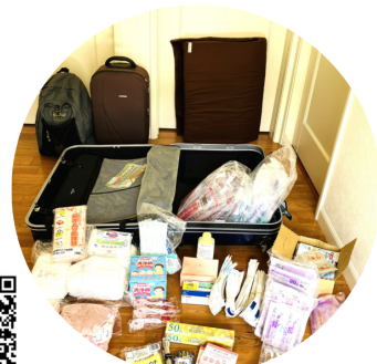
避難時荷物の一例