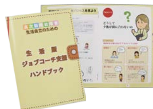
▲生活版IC支援ハンドブック