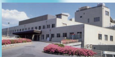
千葉県千葉リハビリテーションセンター

千葉県千葉リハビリテーションセンター 千葉市療育センター 社会福祉法人 まごころ ハイリハジュニア ハイリハ JOB 社会福祉法人 オリーブの樹