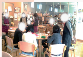
▲毛糸でアクリルたわし作り

■参加費：ワンドリンク付き300円。 イベントにより若干の実費がかかる場合もあり。各月に内容は違うため、お問い合わせください。