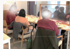
▼こ～じのうカフェの活動様子(2/27C's cafe)

■活動内容：こ～じのうカフェは、美味しい手作りケーキと森のコーヒーを味わいながら、その日のテーマなど決めず、当事者と家族が楽しくしゃべりをしよう、C's cafeを会場に開催しています。カフェには、脳卒中で倒れたご主人を心配するご家族や、社会的行動障害の症状のあるご主人への対応に苦慮されているご家族、いつもカフェを楽しみに参加されている当事者の方々など、様々な境遇の皆さんがひとときの楽しい時間を過ごされています。コロナでC's cafeが休業になった事も有り、現在は4～5人程度の参加となり、NPO法人C'sコミュニティの就労継続支援B型の通所者・職員との交流も行っています。C's cafeは京成本線津駅から徒歩3分と交通も便利です。高次脳機能障害の当事者・家族以外の方でも参加フリーです(参加費¥310)。是非一度ご参加ください。お待ちしております。