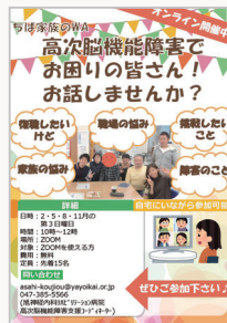
▲ちば家族のWAのチラシ

■活動内容：旭神経内科リハビリテーション病院では、平成25年度より、病気や怪我により高次脳機能障害を患いながら、復職・新規就職を果して現在社会復帰をされた方、これから復職・新規就職を目指し活動しておられる方やその御家族様を対象に懇話会を実施しております。これは、「ピアサポート」と呼ばれる同じ障害を持った方同士が互いに話し合い、支え合うことで、自身の回復や成長につなげて行くプログラムの一つです。現在、zoomを用いたオンライン参加と会場参加のハイブリッド形式で行なっています。ご興味のお有りな方は、ぜひ一度下記までお問い合わせ下さい。 asahi-koujiu@yayoiikai.or.jp