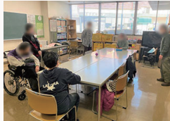
▼ディアひまわりの活動(2/9船橋市障害者福祉センター)

■活動内容①『定例会』会場：船橋市中央公民館 日程：隔月ごとに1回(詳細はお問い合わせください) 内容：家族の困りごとの相談受付や医療・福祉・行政の情報提供、勉強会(例:「親なき後の資産形成」他)等。 ②『千葉市家族会』会場：千葉市花見川ほろテアセンター 日程：毎月第2日曜日 / 内容：千葉市及び近隣にお住いの当事者・家族の相談・情報交換の会。 ③『ディアひまわり』会場：船橋市障害者福祉センター / 日程：毎月第2、第4木曜日 内容：高次脳機能障害の当事者に向けた日中活動(例:各人のお話しコーナー、言葉遊び、簡単な体操等)の機会を設けています。 ④『こ～じのうカフェ』■詳細は⑨をご覧ください。