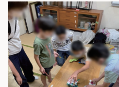
▲工作したものでゲームをする子ども達