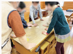
▲『こ～じのうカルタ』で遊ぶ

■活動内容：20～40歳代の方を中心に活動。家族の交流、当事者の交流を通し、ストレス解消の場となっています。千葉市ハーモニープラザをお借りしてスポーツ、ゲーム、音楽療法等を開催。その他、香澄公園、青葉の森公園にお出かけすることもあります。同じ病を持つ仲間と、話したりするのは楽しいし、親としても、経験者の話を聞くのは、参考になるし、安心します。是非、参加して下さい。