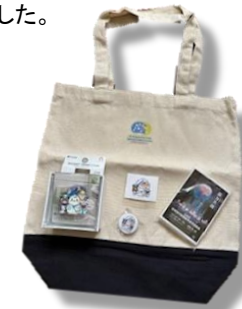
学会グッズ 買っちゃいました