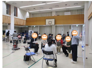
▲例年、大盛り上がりのグループワーク！ ホワイトボードを使いこなします