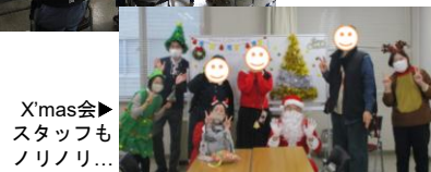
X'mas会 スタッフも ノリノリ...