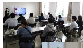
▲合同グループで 真剣にお話を 聞く皆さん