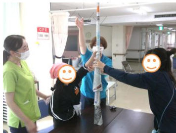
▲新聞紙タワーづくり！