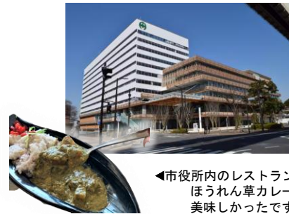
▲市役所内のレストラン ほうれん草カレー 美味しかったです