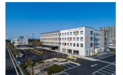
▲回復期病院のスタッフの皆様のお役に立てますように...