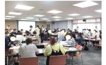
▲3日間、朝から晩まで研修！