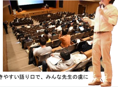
聞きやすい語り口で、みんな先生の虜に