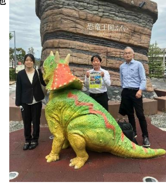
駅前に恐竜がいました...!

コーディネーター研修会、シンポジウムが10/3-4の2日間に渡り行われました。今回の研修会は「知る・気づくから未来を育む」をテーマとし、横浜市独自事業を実施している事業所の取り組みを伺いました。シンポジウムは「つながる・つなげる」をテーマとし福井県における高次脳機能障害者支援のこれまでというテーマで講演がありました。地域移行・職場復帰後の地域での支援や家族の本人への関わり方を知ることができました。