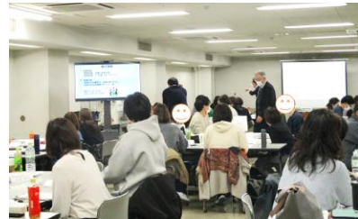
寒い中、今回も3日間！頭から湯気が...