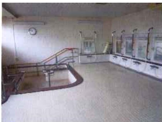
(写真上 居室 写真下 浴室)