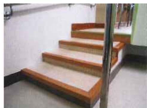
(浴室階段 段差最大 11cm)

利用までに身体障害者手帳の申請準備（診断書作成）や計画相談（相談支援専門員）が決まっているとスムーズな手続きができます。