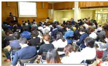
講演・シンポジウム