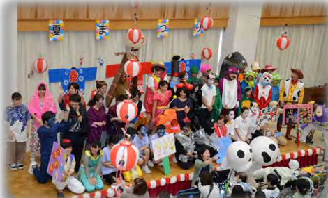
千城台高校音楽部のみなさんによる合唱 参加者全員でつくる楽しいステージでした。