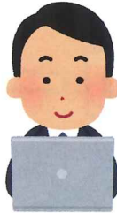
千葉リハセンター