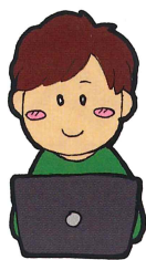
千葉リハセンター

② 申込みされた方に、配信の数日前に視聴専用ホームページの URL をメールでご案内